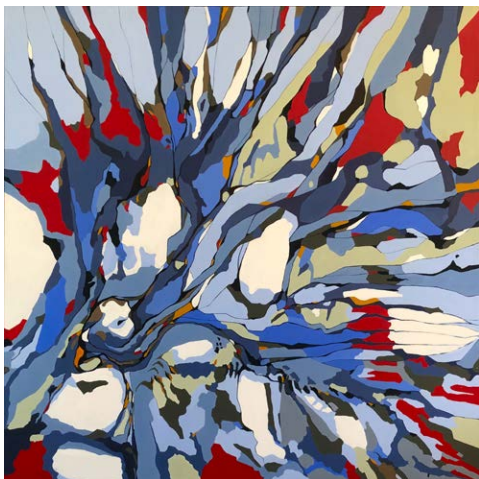
Vingesus, 2023 Akryl på lærred 80 × 80 cm

Farverne er så kommet til på lærrederne. De har skabt billederne for mig og bragt en slags orden i mine kaotiske syn. De lyse og mørke nuancer i kølige blå og grønne farver danner en rygrad i billederne. De forsøger at holde de varme røde, gule og brune farver ud fra hinanden, og midt i disse spændinger lever vingesuset ganske tæt på.