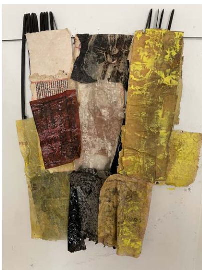
Tableau over Gudinden Isis, 2023 Håndstøbt papir, mixed media 80 × 60 cm

Isis betragtes som en magi-kyndig gudinde med magt over både guder og mennesker. Hun har styrtet Tyrannernes verden, tvunget mændene til at elske kvinderne. Gjort det rigtige stærkere end guld og sølv, og fastslået, at det sande skal betragtes som smukt. Hun har skilt jorden fra himlen og bestemt solens og månens baner.