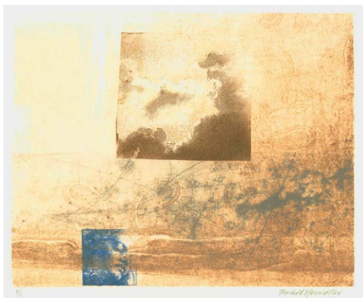
Uden titel, 2023 Xerolitografi 26 x 32 cm

I mine billeder har jeg arbejdet med at kombinere disse elementer med hinanden. Tanken, drømmen og luften.