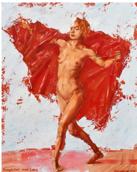
Vingesus med Lara, 2023. Olieskitse på lærred 50 × 40 cm

Jeg maler det jeg ser, eller det jeg husker. Jeg maler det jeg drømmer om, det jeg holder af, det som gør indtryk. Jeg maler det som det er, eller som det kunne være, eller det som ikke kan være til; og det bliver som det nu opstår på lærredet, hvor jeg ser det vokse. Jeg kender mange teorier men følger ingen: jeg sanser, jeg føler, jeg fravælger og vælger, som man høster frugterne fra træet. Vinden suser i musens vinger.