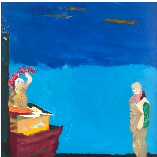
De hører vinden, 2023 Akryl på Lærred 40 × 40 cm

Suset fra vingeslagene rammer træernes blade, og former træets krone. Det får blomsterne til at svaje.