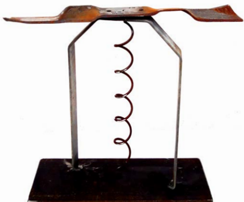
Drømmen om at flyve, 2023 Genbrugsjern 34 × 42 cm

Skulpturen "Drømmen om at flyve" er fra 2023 og fremstillet af sammensvejsede dele af genbrugsjern, bl.a. metalstivere fra et nedlagt skraldeposestativ samt en kniv fra en plæneklipper. Skulpturen er overfladebehandlet med klar, mat lak.