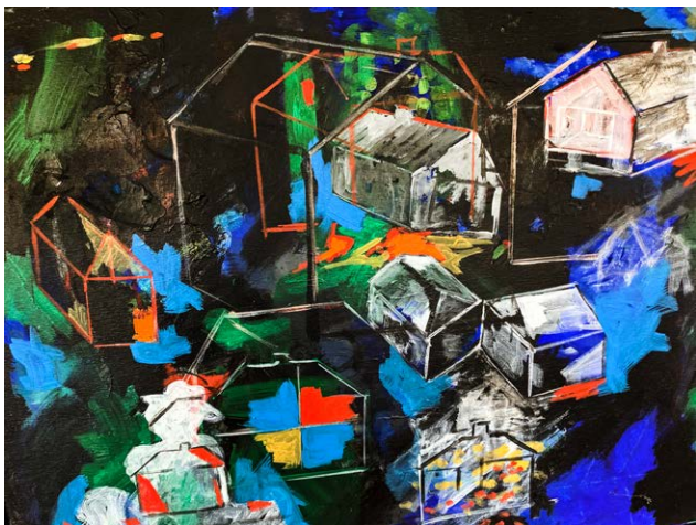
De forladte Huse, 2023. Akryl på lærred 60 × 80 cm

Husenes forladthed i et hjørne af landsbyen ud mod de sidste opdyrkede marker ligger de forladte huse døden er synligt til stede tapeternes billeder og mønstre efterlader illusionen af trykthed de lasede sind sidder i væggene.