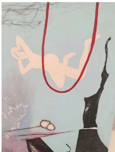
Vingesus Akryl og blyant på lærred, 2023 160 × 90 cm