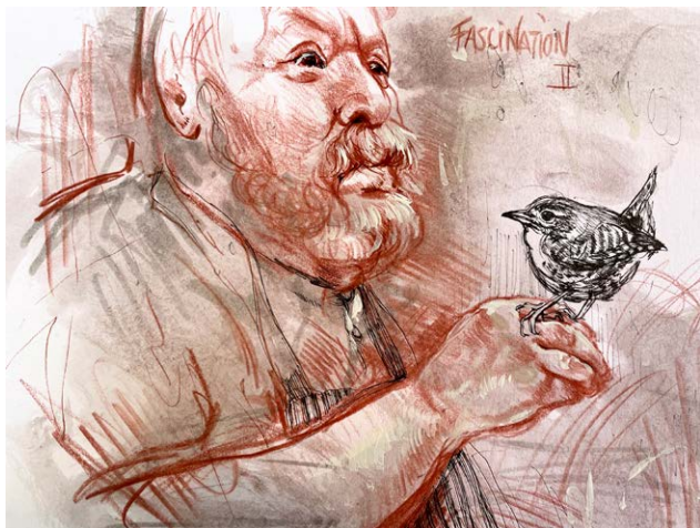
Fascination II, 2023 Blandet teknik på papir 17 × 23 cm

Høj vibration og skønhed – jeg forundres!