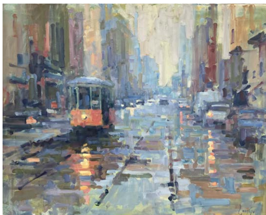
Sporvognen kommer, 2023 Olie på lærred 80 × 100 cm

Hvordan maler man luft? Jeg har eksperimenteret med, hvordan blandt andet forskellige vejrforhold er med til at sløre ting og skabe rum. Det kan være, hvordan regn er i stand til at skabe planer og dybde i bybilledet og give en oplevelse af, at bygninger i baggrunden opløses. Målet er at flytte opmærksomheden fra ting til den atmosfære, der er rundt om og imellem disse ting. Når det anelsesfulde eller antydningssprægede får lov at dominere, kan der opstå en oplevelse af mystik og stemning.